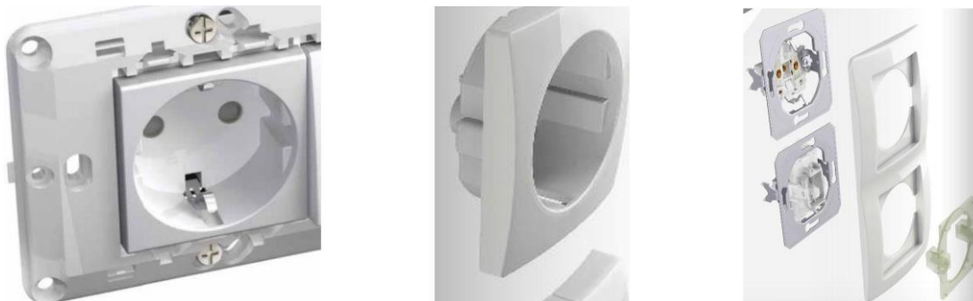
Abbildung 1: Elektroausstattung (Symbolbild)

Die Elektroinstallationen werden nach ÖEV- und Blitzschutz Standard hergestellt. Installationen laut Ausstattungsbeschreibung (siehe Anhang).