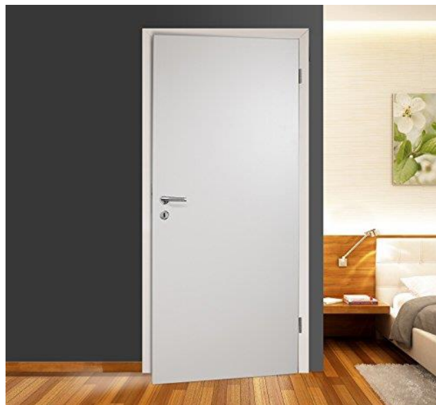
Abbildung 2: Zimmertüre (Symbolbild)

Es sind Holztürblätter (Röhrenspan) sowie Holzzargen vorgesehen. Die Muster dafür liegen beim Kooperationspartner auf.