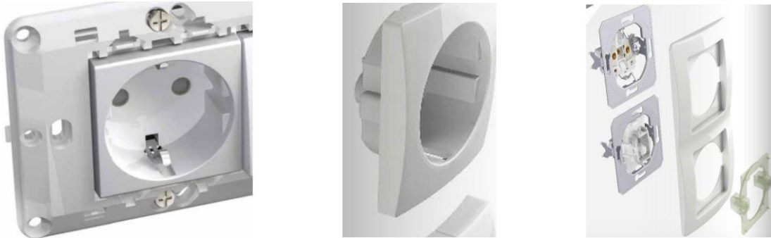
Abbildung 1: Elektroausstattung (Symbolbild)

Die Elektroinstallationen werden nach ÖEV- und Blitzschutz Standard hergestellt. Installationen laut Ausstattungsbeschreibung (siehe Anhang).